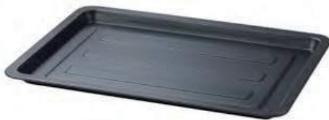
Plaque de cuisson