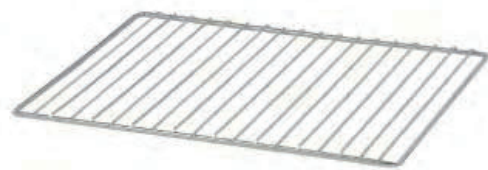
Grille de cuisson